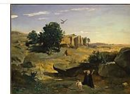
Hagar in the Wilderness Camille Corot (French, Paris 1796–1875 Paris)

Medium: Oil on canvas Accession Number: 38.64